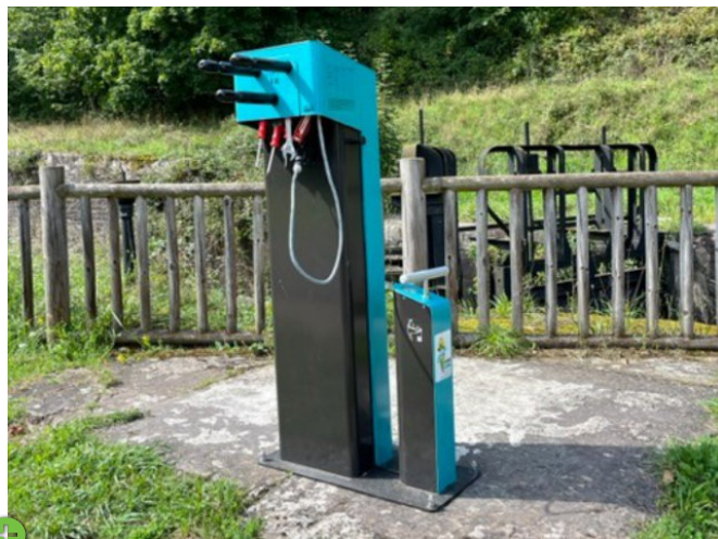
Vallée des Eclusiers, Arzwiller, Frankreich